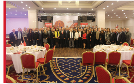
Fatih İlçesi Eğitimimizden