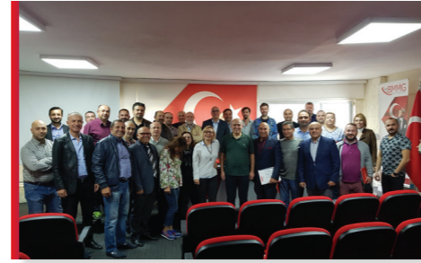
Bağımsız Denetim Sürekli Eğitim Programı