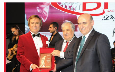
13.03.2019 Grup Gecemiz Erol Evgin'e Plaket Töreni