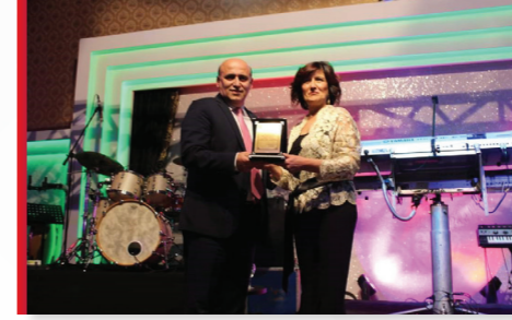
Çekmeköy Gönüllü Anneler Plaket Töreni