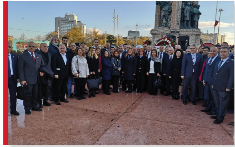
10 Kasım Taksim Anıtı Ziyareti