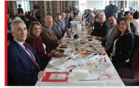
19.04.2019 Ataşehir'de Yapılan 300 Kişilik Eğitim Programımız