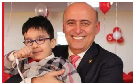
23 Nisan Ulusal Egemenlik ve Çocuk Bayramı Etkinliği