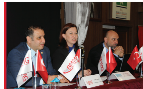
Bahçelievler Eğitimi (Mersis Uygulama Eğitimi)