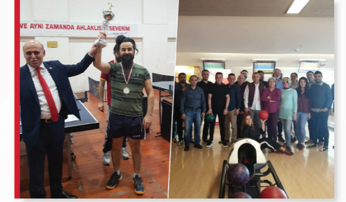
Tenis Turnuvarımız / Bowling Turnuvarımız "Bir Milletün Damarıdır Spor"