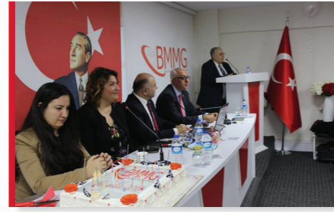
Mesleki Geleceğin Fırsatları ve Tehditleri Konulu Konferans