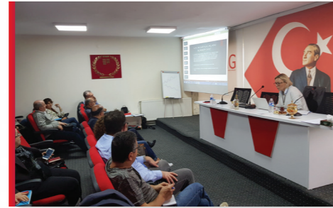
Konkordato Komiserliği Eğitimi