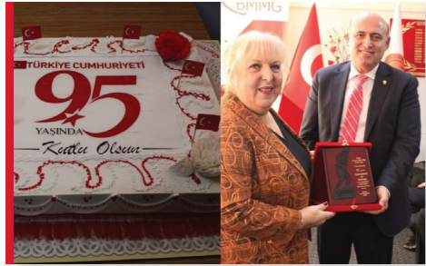
29 Ekim Cumhuriyet Kutlaması