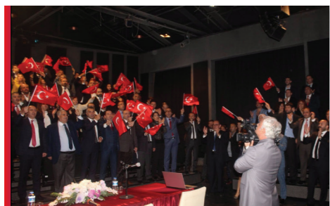
30 Ağustos Zafer Bayramı Bakırköy Balo Salonu