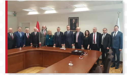
Gelir İdaresi Başkanımız Sayın Bekir BAYRAKDAR'a Ziyaretimiz