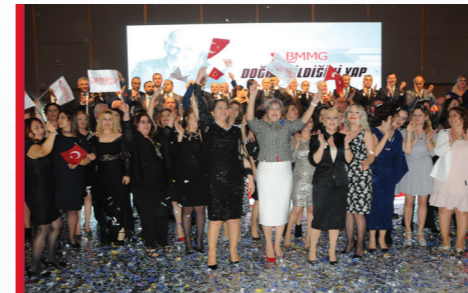
13.03.2019 Grup Gecemiz